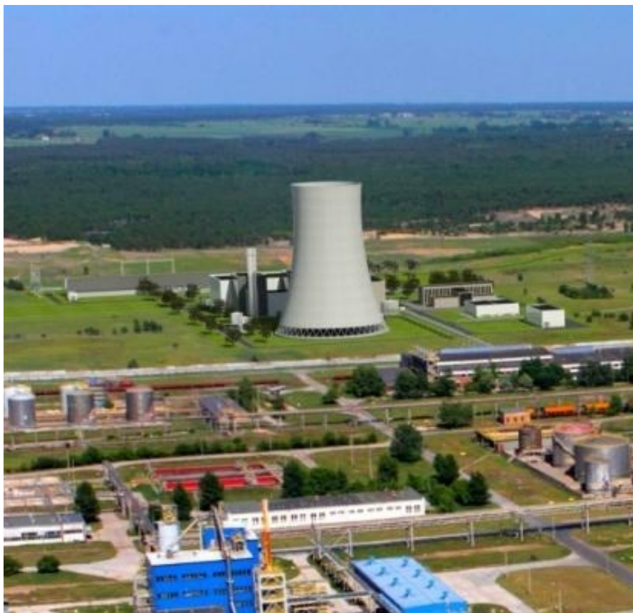
Widok projekt elektrociepłowni

Posiedzenie Rady Pracowników - Omówienie sposobu funkcjonowania Rady wobec obarczenia klauzulami tajności przekazywanych Radzie informacji